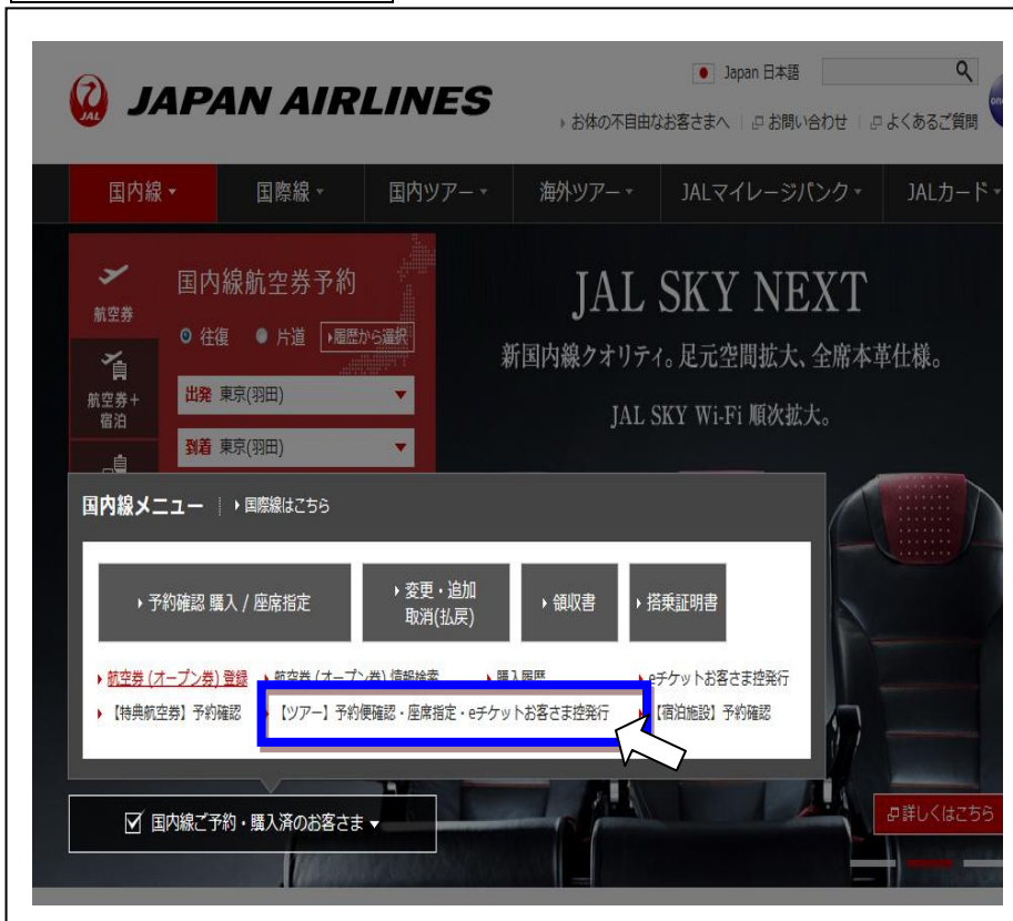
図1 JALパソコンサイト