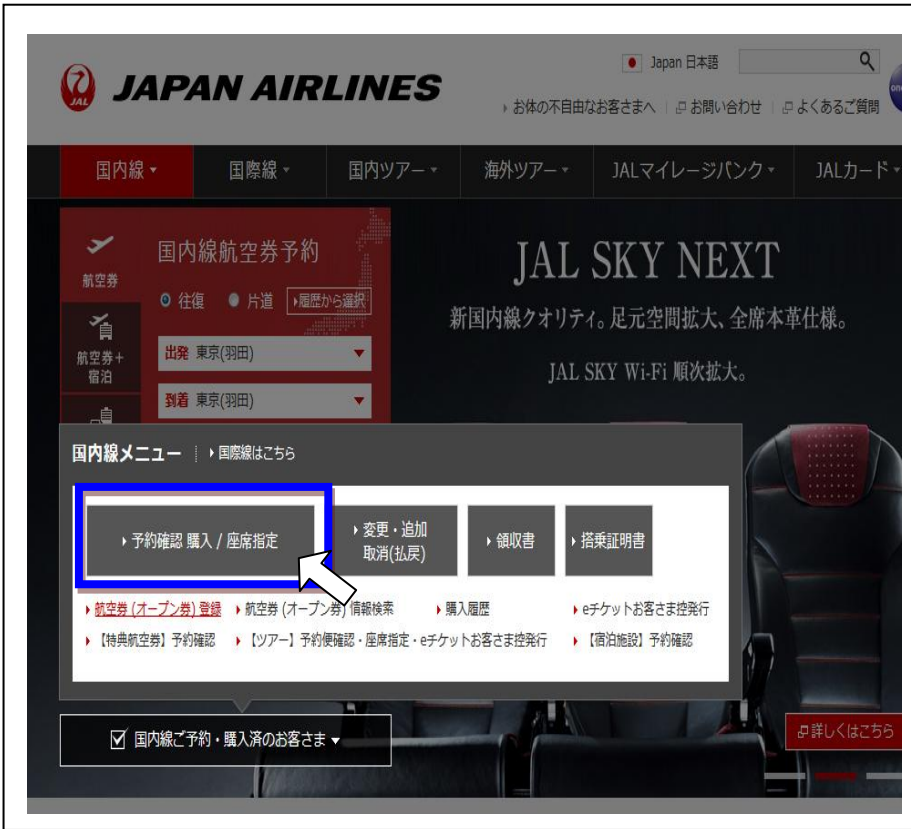
図1 JALパソコンサイト